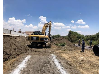
LIMPIA Y TRAZO EN EL AREA DE TRABAJO