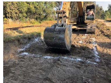
LIMPIA Y TRAZO EN EL AREA DE TRABAJO