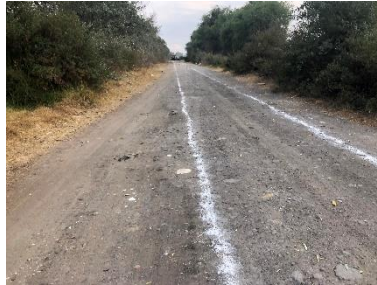
LIMPIA Y TRAZO EN EL AREA DE TRABAJO