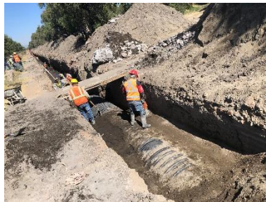
COFORMACIÓN DEL RELLENO EN ZANJA