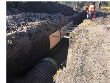
INSTALACIÓN DE TUBERIA SANITARIA DE 42”