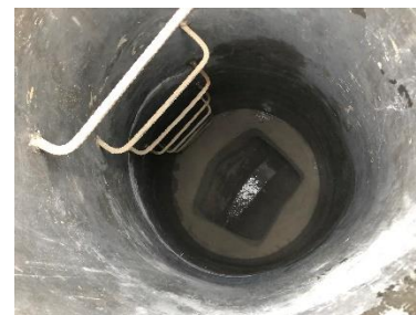
OBRA TERMINADA, POZO DE VISITA PARA VENTILACION Y MANTENIMIENTO DE LA LINEA DEL COLECTOR