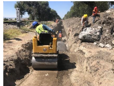
COFORMACIÓN DEL RELLENO EN ZANJA