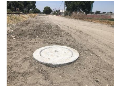
OBRA TERMINADA, POZO DE VISITA PARA VENTILACION Y MANTENIMIENTO DE LA LINEA DEL COLECTOR