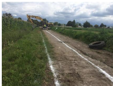
LIMPIA Y TRAZO EN EL AREA DE TRABAJO