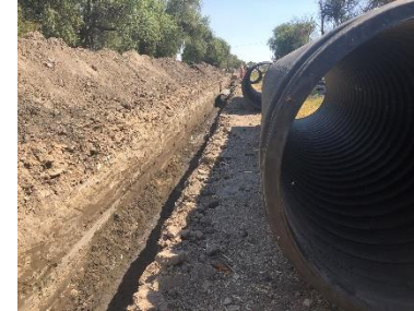
INSTALACIÓN DE TUBERIA SANITARIA DE 48”