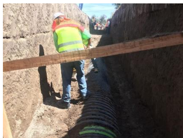
COFORMACIÓN DEL RELLENO EN ZANJA