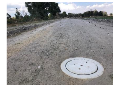
OBRA TERMINADA, POZO DE VISITA PARA VENTILACION Y MANTENIMIENTO DE LA LINEA DEL COLECTOR