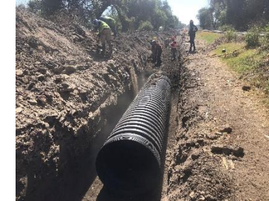
INSTALACIÓN DE TUBERIA SANITARIA DE 48”