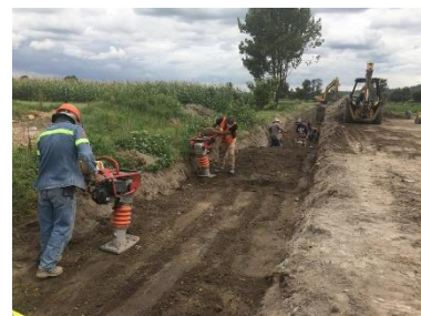
COFORMACIÓN DEL RELLENO EN ZANJA