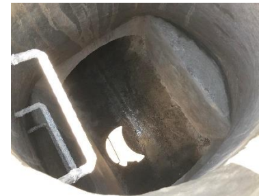
OBRA TERMINADA, POZO DE VISITA PARA VENTILACION Y MANTENIMIENTO DE LA LINEA DEL COLECTOR