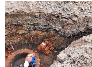
CONSTRUCCIÓN DE POZO DE VISITA