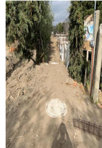
BROCALES Y TAPAS EN POZOS DE VISITA