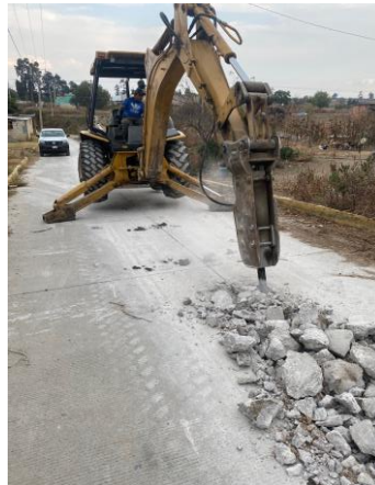
DEMOLICIÓN DE PAVIMENTO DE CONCRETO