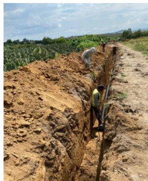
INSTALACIÓN DE TUBERÍA