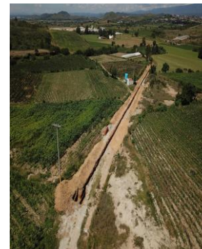
VISTA AÉREA DE EXCAVACIÓN E INSTALACIÓN DE TUBERÍA