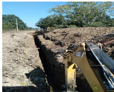
EXCAVACIÓN POR MEDIOS MECÁNICOS PARA LA COLOCACIÓN DE TUBERÍA