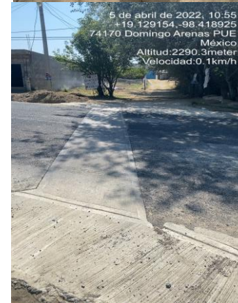
REPOSICIÓN DE PAVIMENTO DE CONCRETO HIDRÁULICO