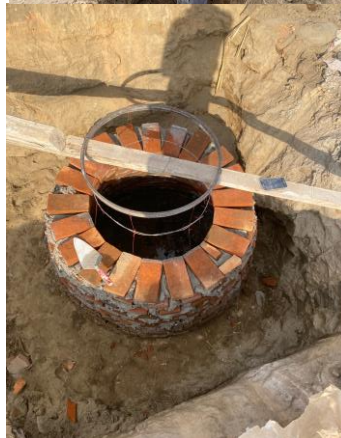
FABRICACIÓN DE POZO DE VISITA