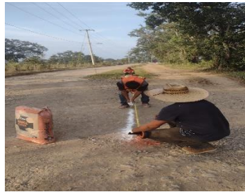
LIMPIA Y TRAZO