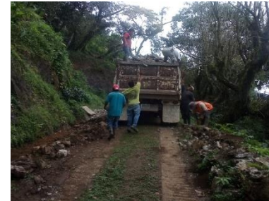
ACARREO DE MATERIAL HASTA EL SITIO DE LA OBRA