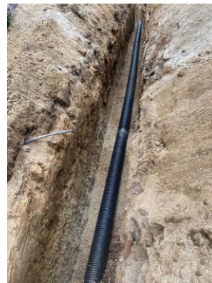
INSTALACIÓN DE TUBARÍA