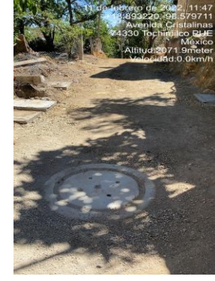
BROCAL Y TAPA DE POZO DE VISITA