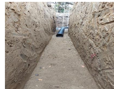
AFINE DE PLANTILLA PARA LA COLOCACIÓN DE TUBERÍA