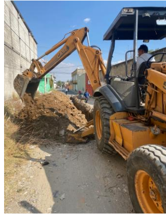
EXCAVACIÓN PARA INSTALACIÓN DE TUBERÍA