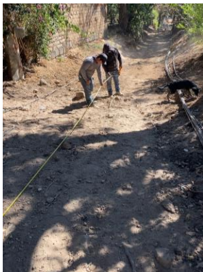
LIMPIA Y TRAZO PARA LÍNEA DE DRENAJE