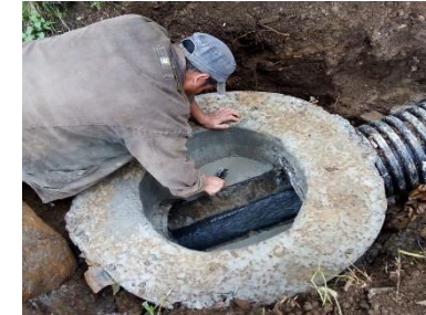
CONSTRUCCIÓN DE POZOS DE VISITA E INSTALACIÓN DE TUBERIA DEL COLECTOR SANITARIO