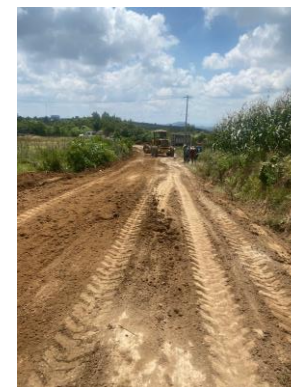
CONFORMACIÓN DE TERRACERÍAS