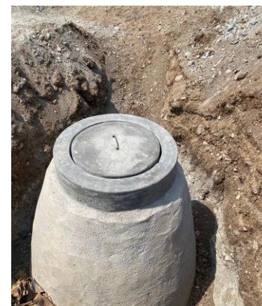
POZO DE VISITA