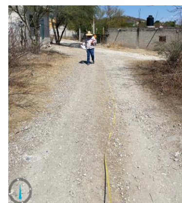
RECORRIDO OBRA TERMINADA