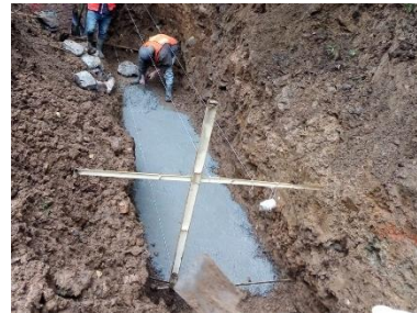
TRABAJOS PRELIMINARES, CONSTRUCCIÓN DE PLANTILLA DE CONCRETO SIMPLE