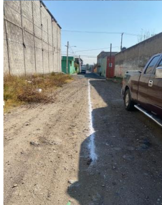
TRAZO DE LÍNEA PARA AMPLIACIÓN DE DRENAJE SANITARIO