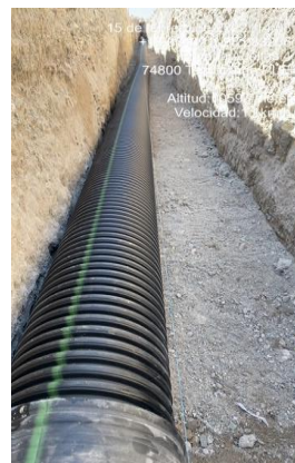
INSTALACIÓN DE TUBERÍA