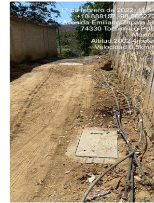
REGISTRO DE DESCARGA Y BROCAL CON TAPA