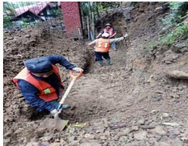
TRABAJOS PRELIMINARES, EXCAVACION A MANO