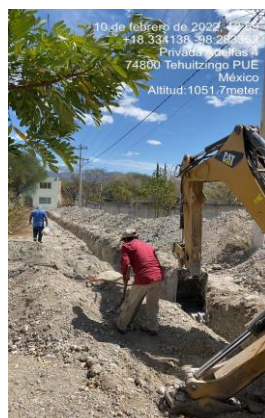
EXCAVACIÓN EN ROCA