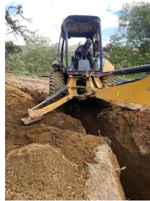
EXCAVACIÓN CON MAQUINARÍA