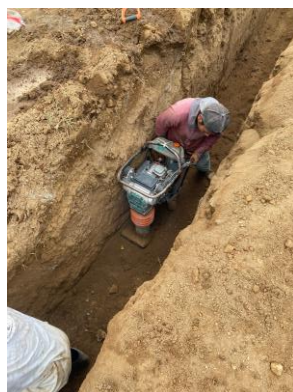
RELLENO Y COMPACTACIÓN