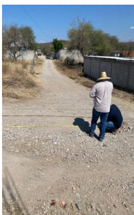
LIMPIA Y TRAZO PARA LÍNEA DE DRENAJE