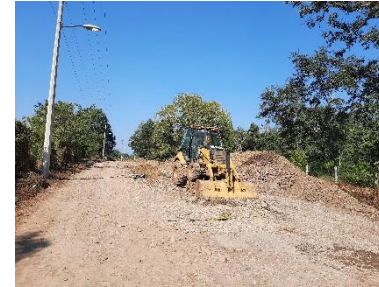
EXCAVACIÓN PARA LA COLOCACION DE TUBERÍA