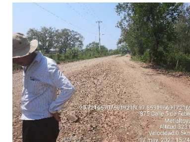
OBRA TERMINADA, DE LA RED DE ALCANTARILLADO SANITARIO