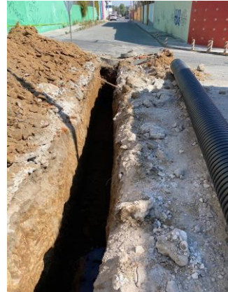
ACARREO PARA INSTALACIÓN DE TUBERÍA