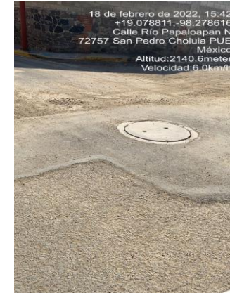
REPOSICIÓN DE PAVIMENTO ASFALTICO PARA ENTREGA