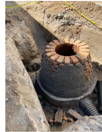
CONSTRUCCIÓN DE POZO DE VISITA