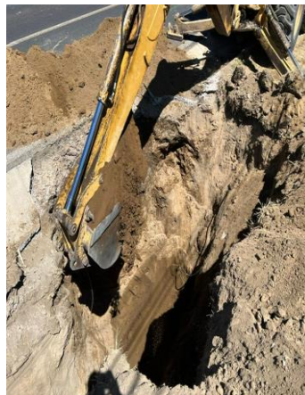
EXCAVACIÓN EN MATERIAL COMUN PARA FABRICACIÓN DE POZO