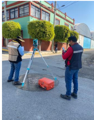
RECTIFICACIÓN DE NIVELES CON EQUIPO TOPOGRÁFICO