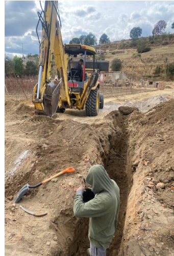
EXCAVACIÓN PARA INSTALACIÓN DE LÍNEA DE DRENAJE SANITARIO