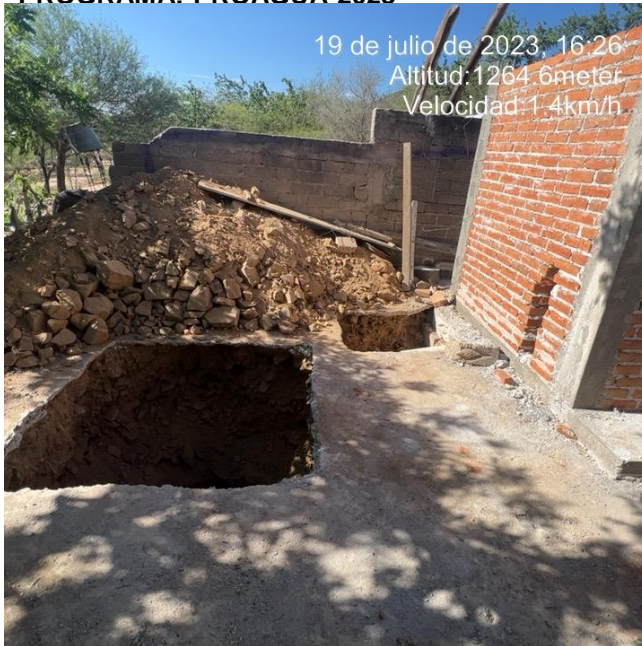
MURO DE TABIQUE