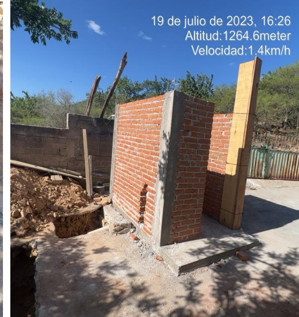
MUROS DE TABIQUE Y LOSA CIMENTACIÓN