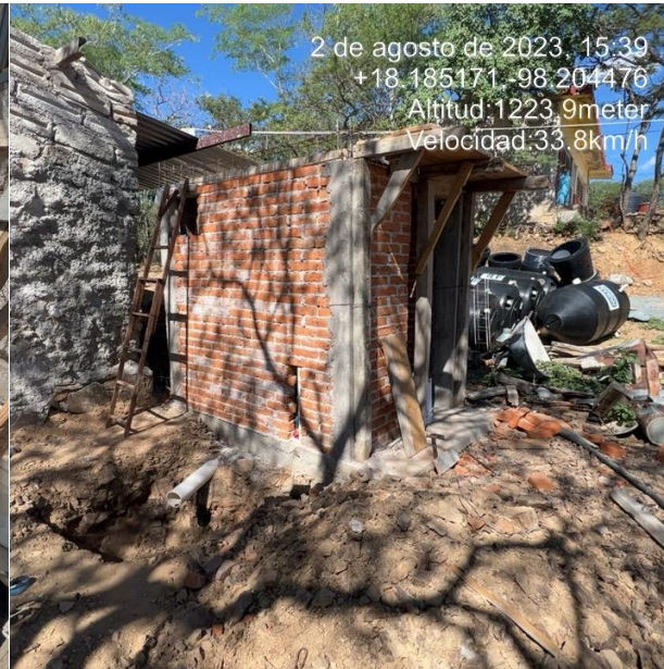
COLADO DE LOSA DE ASOTEA