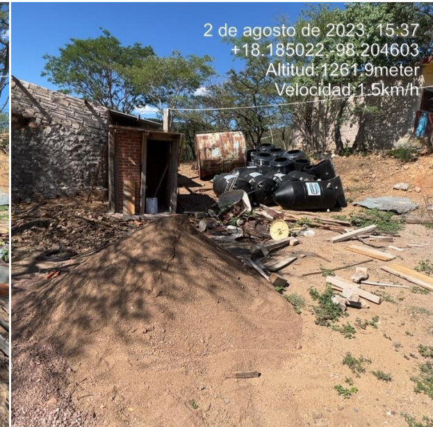
CASETA Y SUMINISTRO DE BIODIGESTORES