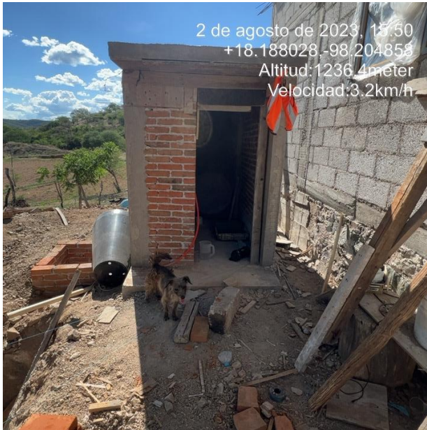
CASETA OBRA NEGRA